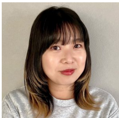
LEE hair garden Ri-dere. 店長

和歌山市在住、IBW美容専門学校在学中にhair Ri-dere. (ヘアリーデレ(旧名称))入社。2012年3月 hair garden Ri-dere. (ヘアガーデンリーデレ)に移転後、店長に就任。お客様への対応は120%の全力で！がモットーに、日々を楽しみながら、お悩みを解決できるよう探求している。ライフスタイルに合わせた提案を心がけている。