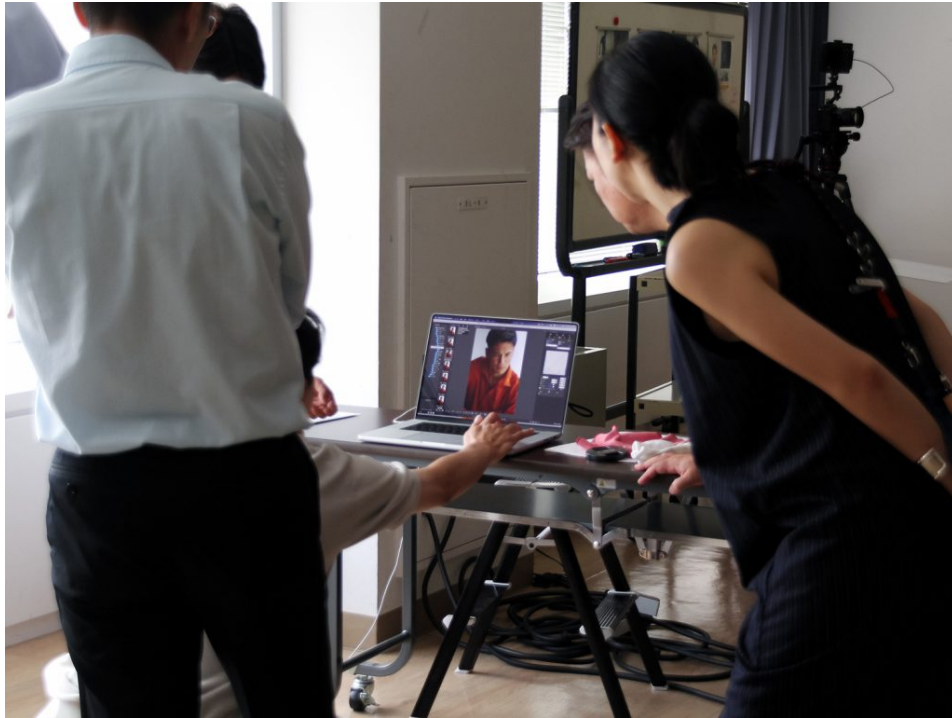
その場で採用候補のカットを決めていきます。

どのカットに対しても、ため息のように漏れてくる「かっこいい……」というスタッフの声。その中で、フォトグラファーさんは的確かつスピーディーに採用候補のカットを選択されていました。