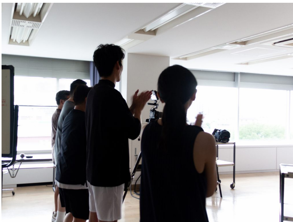
撮影終了の瞬間、スタッフみんなから拍手が湧き起こりました。