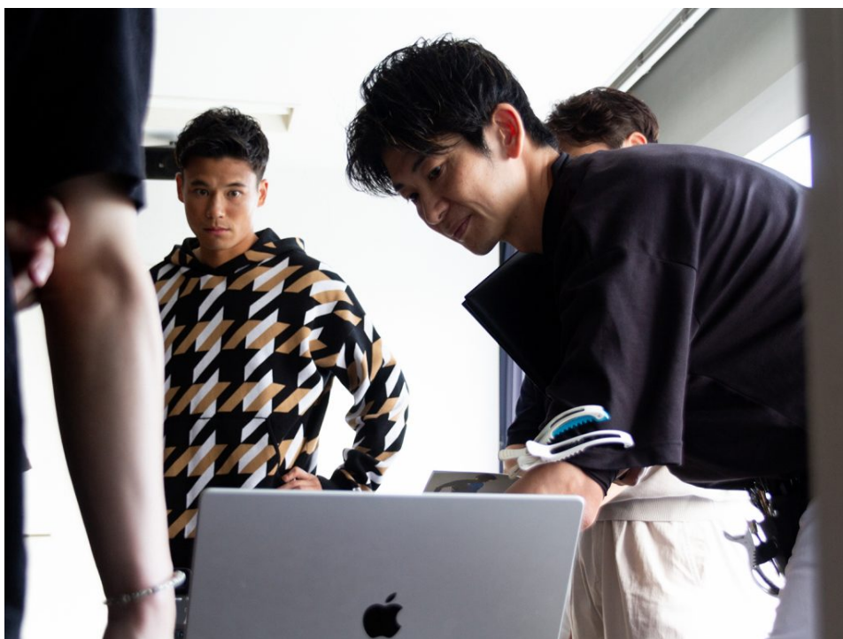
宮市選手も撮影された写真を真剣にチェック。