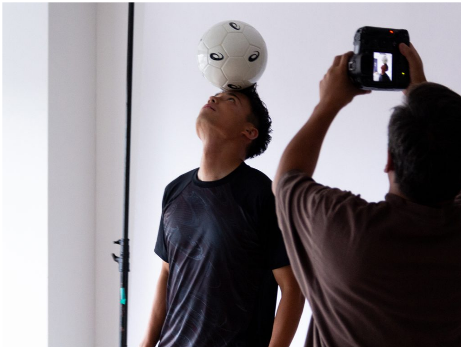
動いても、ボールを頭に乘せても、崩れません。