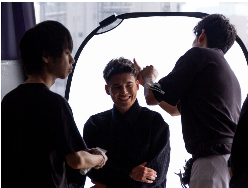
撮影の合間にスタイルを整えます。

先ほどまでの爽やかさとはまた雰囲気異なるかっこよさに。ここからは、パーマスタイルで複数の衣装に着替えて撮影を続けます。